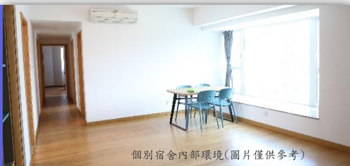
個別宿舍內部環境(圖片僅供參考)

研究生宿舍均為校外宿舍，分佈於澳門半島、離島及路環區域；宿舍房間內一般設有書桌、衣櫃、床、空調等基本設備，全天供應冷熱水。