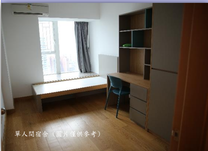
單人間宿舍(圖片僅供參考)

秋季入學者的宿舍入住期為9月~6月，倘新學年繼續入住宿舍，需要重新向大學提出申請，詳情可留意學生事務處未來發出的宿舍申請通告，宿費詳情請參閱大學網站： 入讀科大 > 學費及其他繳費 > 學生宿舍收費 。宿費之高低表示所在地點、宿舍標準及共用衛浴設備的差異。